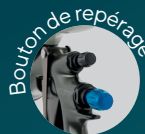
Bouton de repérage

La solution idéale pour gagner en efficacité et en temps. Aucun ponçage n'est nécessaire.